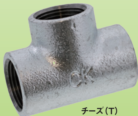
チーズ (T) S0-00-C100