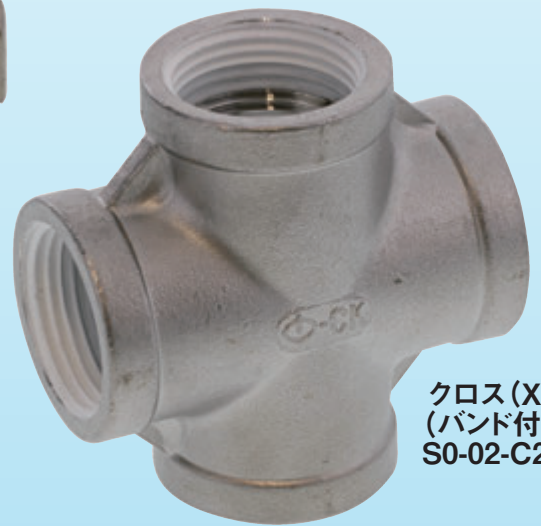
クロス(X) (バンド付) S0-02-C201