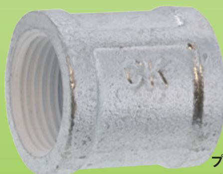
プレシール ソケット (S) (バンド付) S0-00-C301