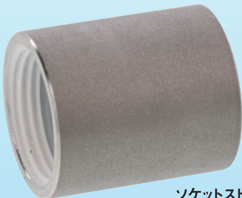
ソケットストレート(S) S0-02-C300