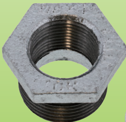
ブッシング (Bu) S0-00-C800