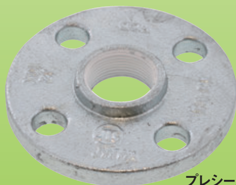
プレシール 合フランジ S2-00-C100